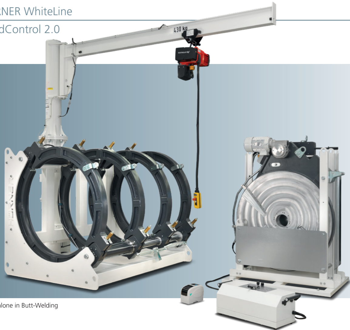
Stand-alone in Butt-Welding