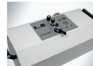
Frontfolie mit GT-Tastatur