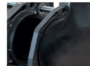
Industrierausführung – Optional sind die Grundmaschinen (250, 315, 355, 500, 630) auch in Industrierausführung mit modifizierter 3. Spannbacke zum Spannen von kurzschenkligigen Formstücken erhältlich. 2)