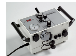
Alle Anschlüsse auf der Gehäuserückseite