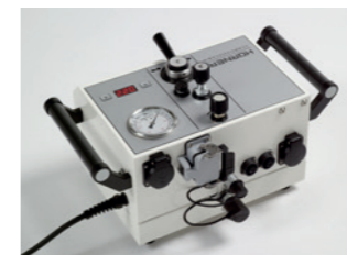
Alle Anschlüsse auf der Gehäuserückseite