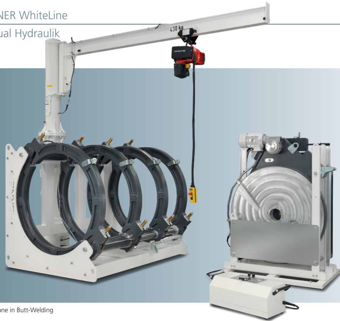
Stand-alone in Butt-Welding